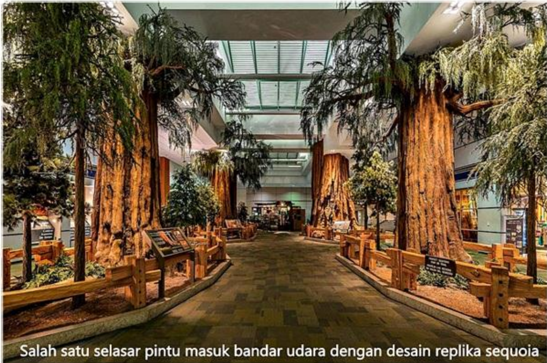
Salah satu selasar pintu masuk bandar udara dengan desain replika sequoia